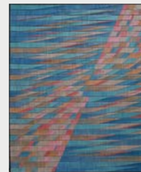
Christiane Dreyer „Zwischen Tag und Nacht“ 120 x 98 cm Wellpappe/Baumwolle, 2007