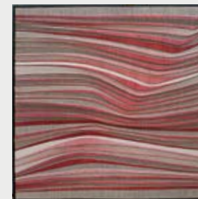
Christiane Dreyer „Lux umbra“ 104 x 104 cm Wellpappe/Baumwolle, 2007