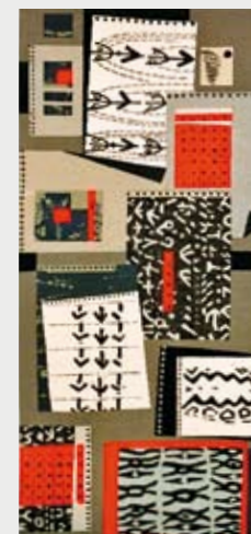
Ursula Jaeger „Reiseskizzen“ 250 x 125 cm Leinen, 1997

Präsentation der während des Symposiums begonnenen Tapissereien zum Thema „Inspiration Kloster Lüne“.